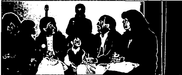
Encuentro en la Zona Oeste