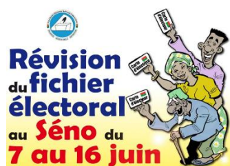
Figure 2: Affiche créée par la Commission Électorale Nationale Indépendante (CENI) du Burkina Faso pour la révision du fichier électoral en juin 2020

bureaux de vote de chaque centre de vote en fonction de leur tranche d'âge pour faciliter la collecte de données sur la participation des jeunes le jour des élections. De plus, pour les élections municipales de mai 2018, l'ISIE a inclus dans son site internet des messages audio expliquant les procédures de vote et fournissant les noms des candidates sur les listes des 350 circonscriptions. Durant les élections présidentielles et législatives de 2019, la gamme des informations disponibles sous format audio sur le site internet de l'ISIE s'est élargie à des décisions et communiqués émis durant le processus à l'intention des électeurs/trices. De plus, toutes les réunions publiques avec les parties prenantes et les conférences de presse tenues par l'ISIE étaient rendues disponibles simultanément en langue des signes.