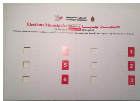
Figure 3: Pochette tactile utilisée en Tunisie en occasion des élections communales 2018

D'autres mesures permettent la participation des personnes ayant un handicap visuel : il s'agit des dispositifs d'assistance au vote , comme par exemple les pochettes tactiles. Ces instruments peuvent être placés sur un bulletin de vote ordinaire, ils sont réutilisables et garantissent le secret du vote parce qu'ils rendent autonome la personne aveugle ou ayant une vision réduite et en lui permettant de voter sans avoir besoin